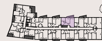
LOKAL 14 | PIĘTRO 1